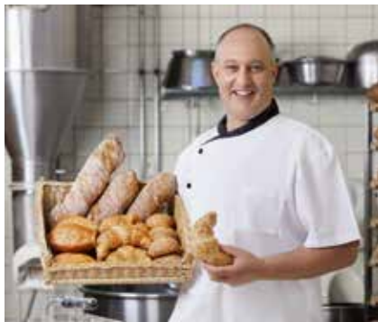
Pekárny a cukrárny